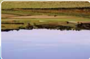
Paysage vallonné Vue de la descente de Mageloup - Floirac

En remontant de Floirac à Mageloup, le circuit passe au Bois des Groises (60 m d'altitude), point culminant du Pays Royannais. Le Moulin du Clopinet offre un magnifique point de vue où l'on peut embrasser l'estuaire de Pauillac au Verdon.