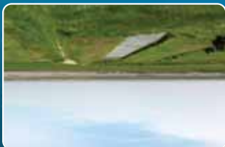
Marais de Mortagne

Au lieu-dit "La Gravelle", vous empruntez une ancienne voie de chemin de fer réhabilitée pour les circuits de randonnées. Jadis, elle servait pour le transport du matériel et des personnes à l'ancienne cimetière, identifiable par ses 2 grandes cheminées.