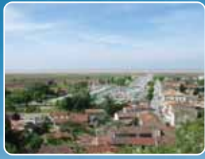
Port de la Rive

Au mois de juillet, l'Immortelle teinte les falaises de jaune et les parfume de son odeur de curry. C'est elle que l'on retrouve sur les dunes de la Côte Sauvage. Habituee des embruns, elle nous rappelle que l'océan n'est pas si éloigné et que dans l'estuaire, se mélangent eau douce et eau salée.