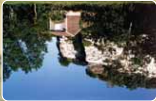
Falaise morte à Mortagne

Les falaises qui ne subissent plus les assauts des eaux estuariennes sont nommées "falaises mortes". Leur alignement majestueux domine les polders d'une hauteur de 50m.